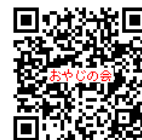
おやじの会QRコード