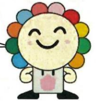
さいたま市選挙キャラクター「みらいクン」

選挙の大切さや投票の参加を呼びかけ、明るい選挙を実現するために役立つ印象深いイメージのポスターを児童・生徒の皆さんから募集します!!