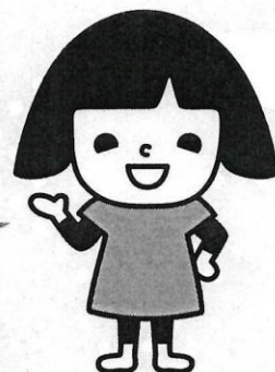
笑味ちゃん

JAグループがすすめる「みんなのよい食プロジェクト」の一環として、これからの食・農を担う次世代の子どもたちに、お米・ごはん食、稲作など、日本の食卓と国土を豊かに作りあげてきた稲作農業全般についての学びを深めてもらうとともに、子どもたちの優れた作品を顕彰することをつうじて、稲作農業の多面的機能と、お米・ごはん食の重要性を広く周知するために開催しています。