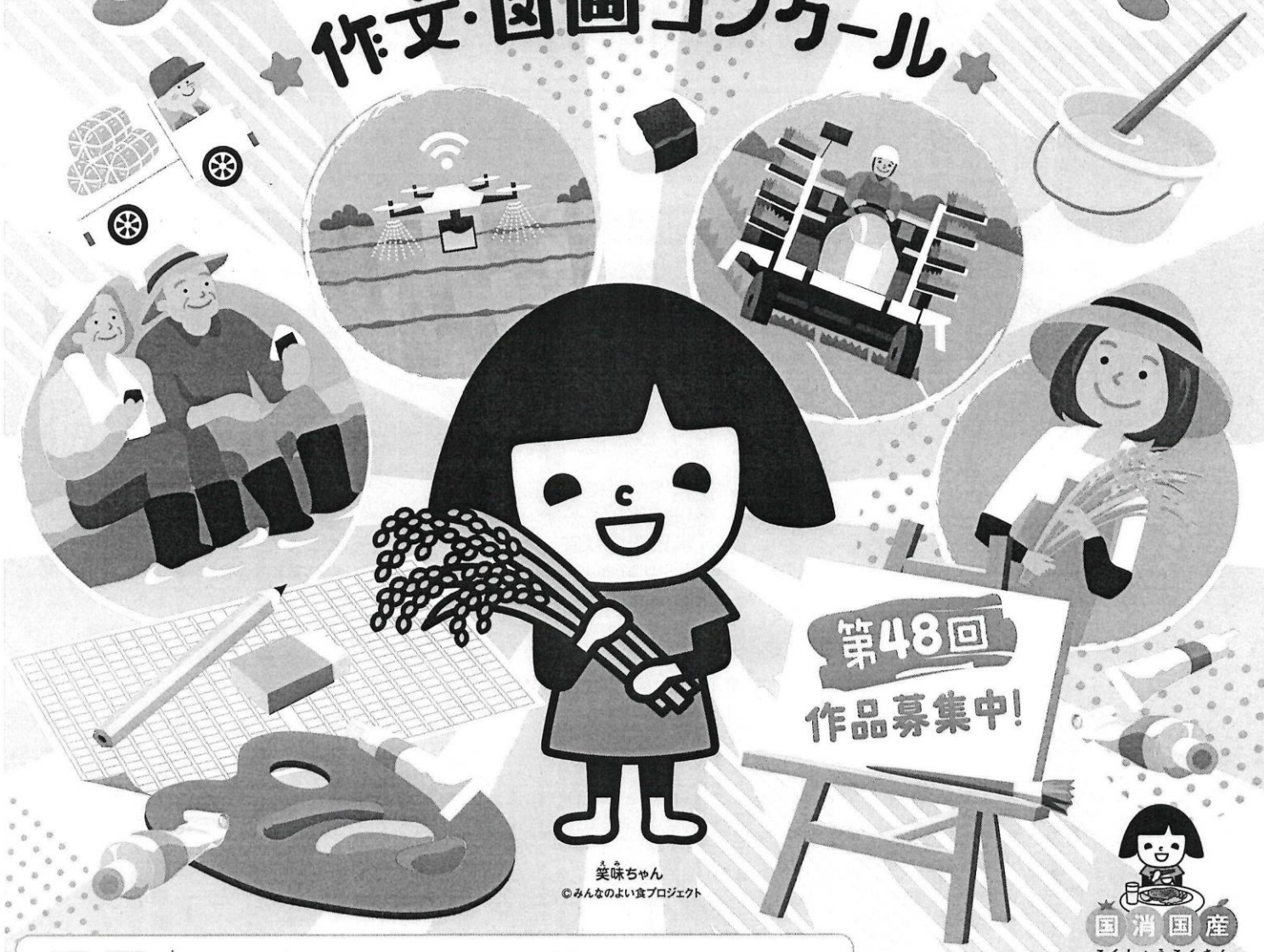
笑味ちゃん