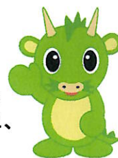
さいたま市 PRキャラクター つなが竜ヌウ

学校はお休みになりますが、市内の公共施設では入場が無料になったり、催し物が開催されたりしますので、市ホームページを参照いただき、ご家族で足をお運びいただくのもよいかもしれません。