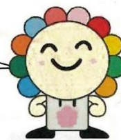
さいたま市選挙キャラクター「みらいくん」

選挙の大切さや投票の参加を呼びかけ、明るい選挙を実現するために役立つ印象深いイメージのポスターを児童・生徒の皆さんから募集します!!